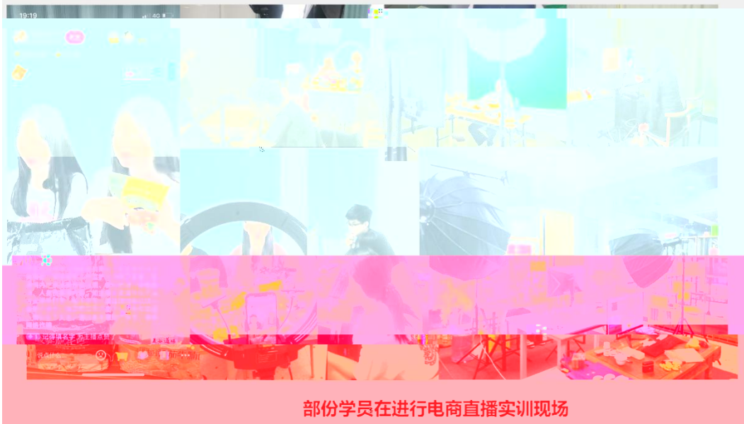
部份学员在进行电商直播实训现场